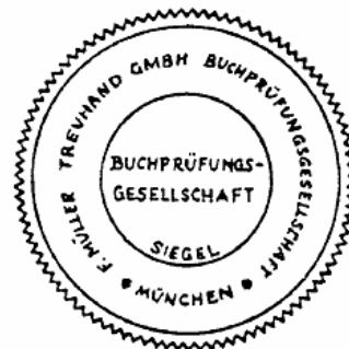
Siegel einer Buchprüfungsgesellschaft